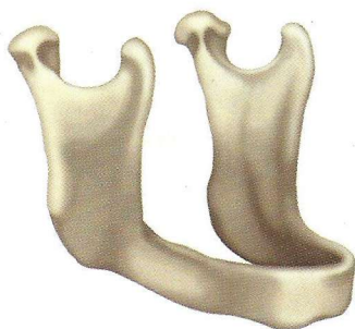
résorption d'environ 10 ans