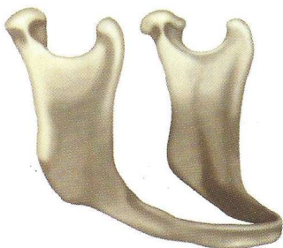
résorption d'environ 30 ans